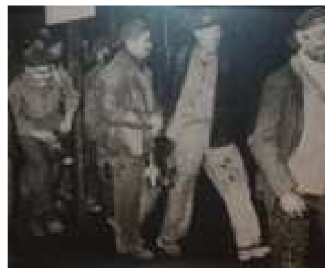
Mineurs du Nord-Pas-de-Calais

8. Quelles sont les causes du mécontentement des mineurs ?