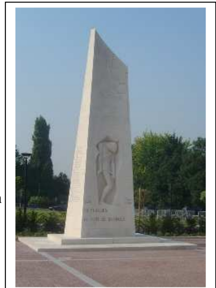
Le mémorial de 1965

5. Sur le plan ci-dessous, vous pouvez constater que les deux-tiers du fort ont été détruits en septembre 1944. Associez chaque lettre à un des noms suivants : Mémorial, Musée, Cour Sacrée.